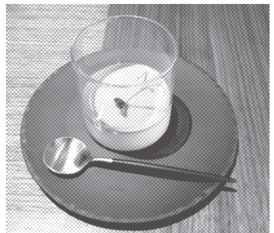
NOHGA HOTEL にて 新玉ねぎとグリーンピースのスープ